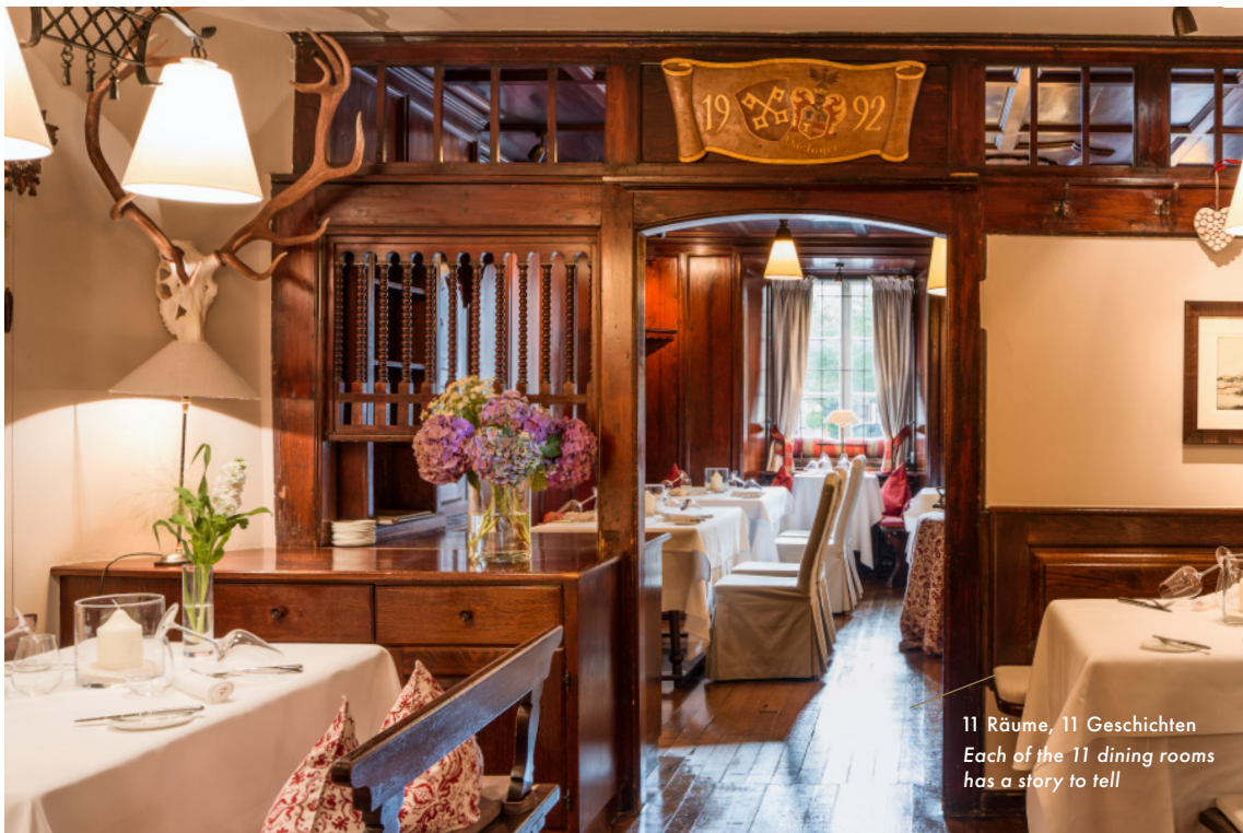
11 Räume, 11 Geschichten Each of the 11 dining rooms has a story to tell