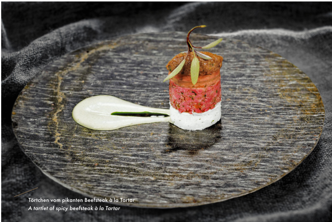
Törtchen vom pikanten Beefsteak à la Tartar A tartlet of spicy beefsteak à la Tartar